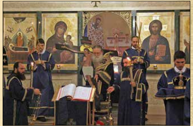
Утреня на Велики петък с 12-те евангелски четива за Христовите страдания