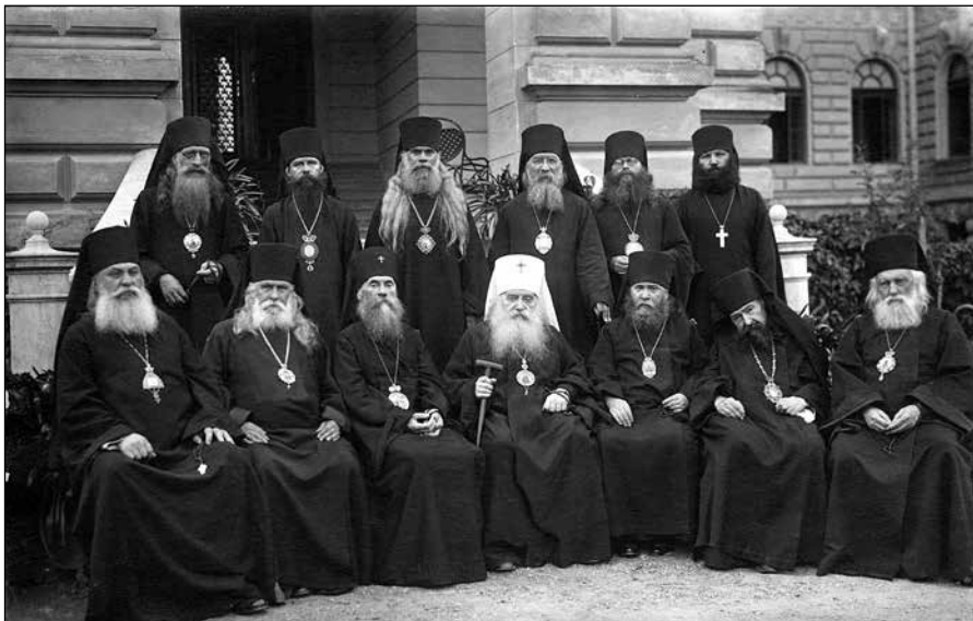
Съборът на руските загранични архиереи, 27 август 1932 г.