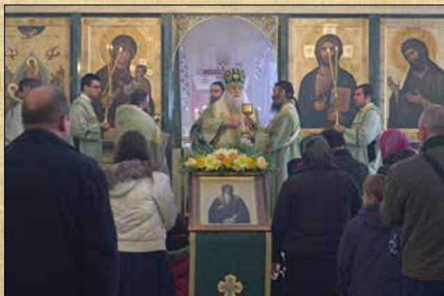
Причастяване по време на св. Литургия и литийно шествие на празника на преп. Йоан Рилски, 1 ноември (19 октомври ст. ст.)