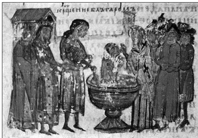
Покръстването на българите. Миниатюра от Ватиканския препис на Манасиевия летопис – XIV в.

светкавична и била благоприятствана от обстоятелствата. Лятото на 863 г. било много неблагоприятно за България – тя претърпяла тежко, 40-дневно земетресение, което било последвано от суша и други природни бедствия. Тежката сянка на глада надвиснала над българската държава. И когато през есента