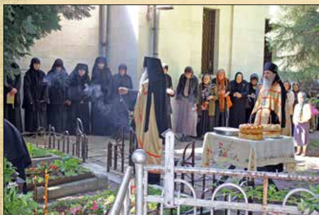
Панихида за архимандрит Сергей (Язджиев) по случай седемгодишнината от кончината му, 3 юни (21 май ст. ст.)