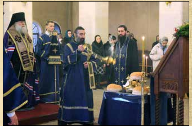
Освецаване на петохлебие на бденната служба на празника Благовещение на Пресвета Богородица, 7 април (25 март ст. ст.)