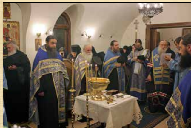
Малкото освещаване на параклиса „Покров Богородичен“ в Княжевския манастир, извършен от Негово Преосвещенство Триадицият епископ Фотий, 11 октомври (28 септември ст. ст.)