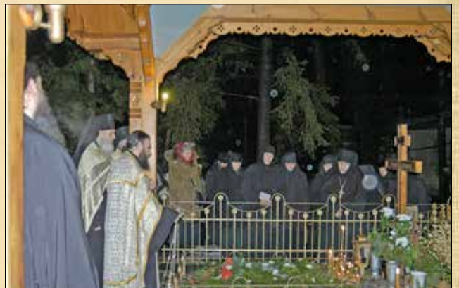
Трисагион за архимандрит Серафим (Алексиев) на неговия гроб в Княжевския манастир „Покров Богородичен“, 25 януари (12 януари ст. ст.)