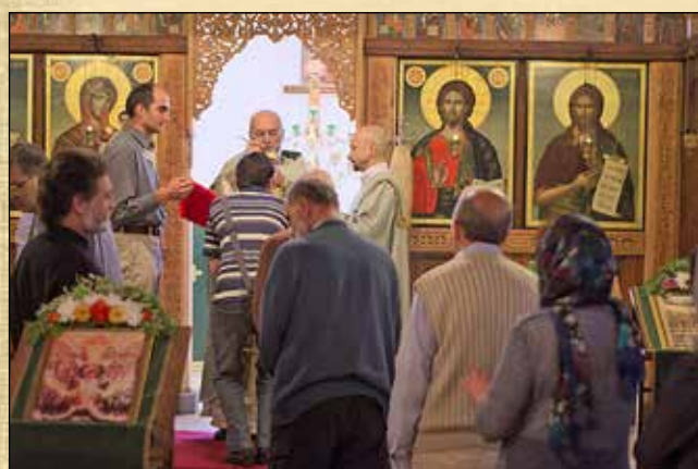
Престолният празник в чест на Всички български светци на приземния храм „Св. Йоан Рилски и всички български светци“ при катедралния храм „Успение Богородично“, 14 юни (1 юни ст. ст.)