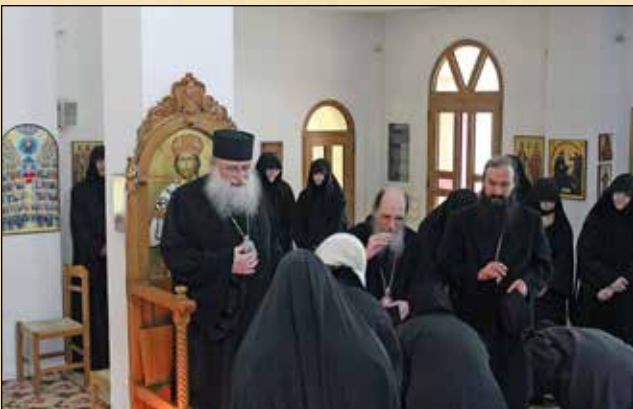
Посещение в женската обител „Свети Ангели“ в Афидни, Атика, 27 януари (14 януари ст. ст.)