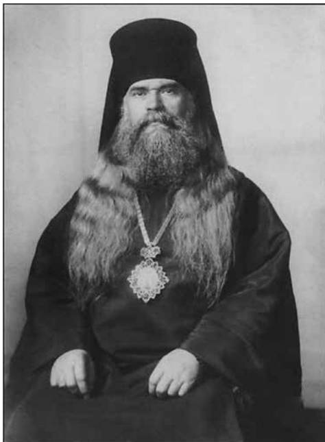
Архиепископ Серафим (Соболев)