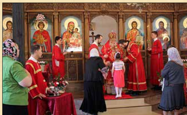
Престолният празник на храм „Живоприемен източник“, гр. Сандански, Светли петък, 17 април (4 април ст. ст.)