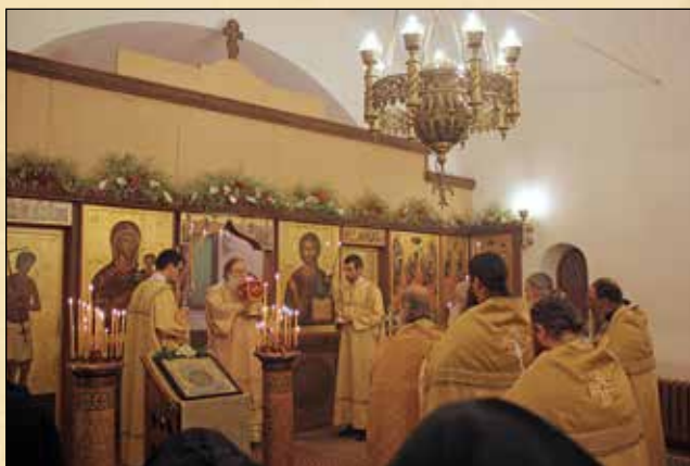
Св. Литургия в Княжевския манастир за престоления празник на главния манастирски храм „Св. апостол и евангелист Лука“, 31 октомври (18 октомври ст. ст.)