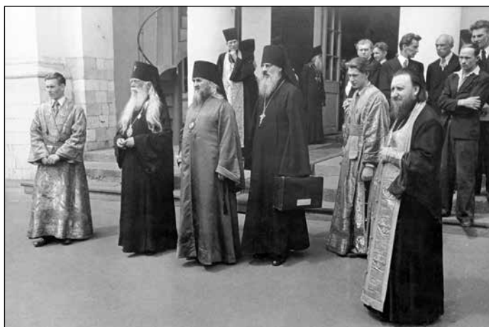
Архиепископ Серафим (Соболев) заедно с архимандрит Пантелеймон (Старицки) в Москва, 1948 г.

През 1948 г. се случва важно събитие в българския църковен живот. Екзарх Стефан е снет от длъжност с правителствено решение и на 6 септември е принуден да подаде формално оставка. Причина за това е несъгласието му с политиката на комунистическата власт спрямо Българската Църква и противопоставянето му на опитите ѝ за намеса в работата на Синода.