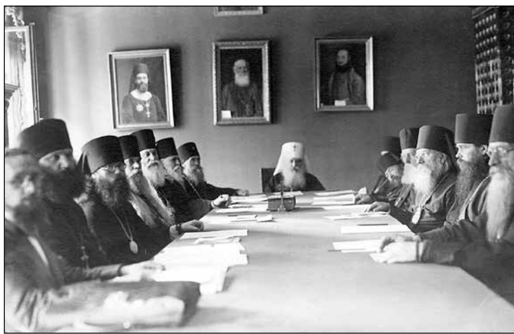
Заседание на Събора на руските загранични архиепископи на заседание, 27 август 1932 г.

P.S. Това писмо беше отправено от мен до архиепископ Вениамин в отговор на поместената в неговото списание „За православието“ политическа бележка на Полтавския архиепископ Теофан, в която м[итрополит] Антоний и аз сме обвинени в ерес.