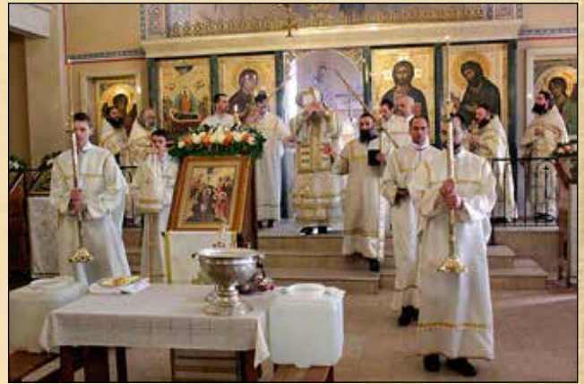
Великият водосвет на празника Богоявление в катедралния храм „Успение Богородично“, 19 януари (6 януари ст. ст.) 2015 г.