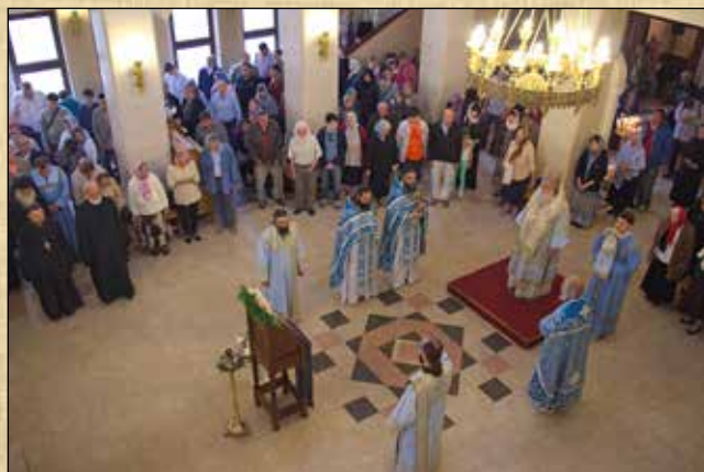
Св. Литургия за празника Рождество Богородично, 21 септември (8 септември ст. ст.)