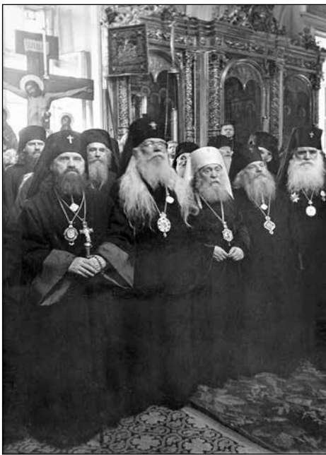
Архиепископ Серафим (Соболев) в Москва, 1948 г.

В този отговорен труд отново му сътрудничи Олга Ливен, сега вече монахиня Серафима. Тя всеки ден идва при светителя, преписва на белова подготвените от него текстове, прави необходимите справки, уточнява бележките по линия. В библиотеката в Богословския факултет мона-