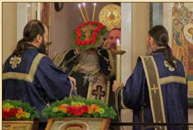
Изнасяне на св. Кръст в края на бденната служба срещу Неделя трета на Великия пост – Кръстопоклонна, 15 март (2 март ст. ст.)