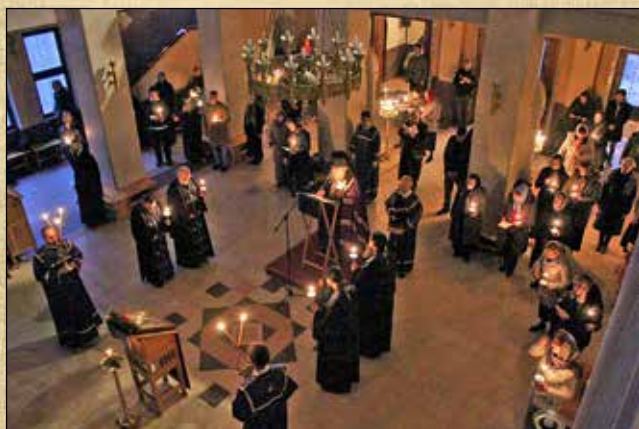
Велик покаен канон на св. Андрей Критски в понеделник от първата седмица на Великия пост, 23 февруари (10 февруари ст. ст.)