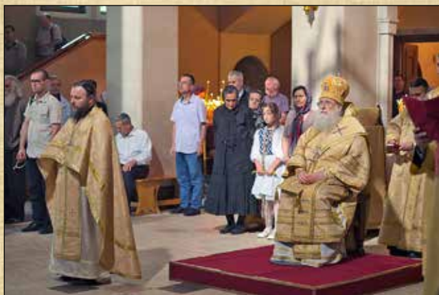
По време на часовете преди св. Литургия за празника на светите първовърховни апостоли Петър и Павел, 12 юли (29 юни ст. ст.)