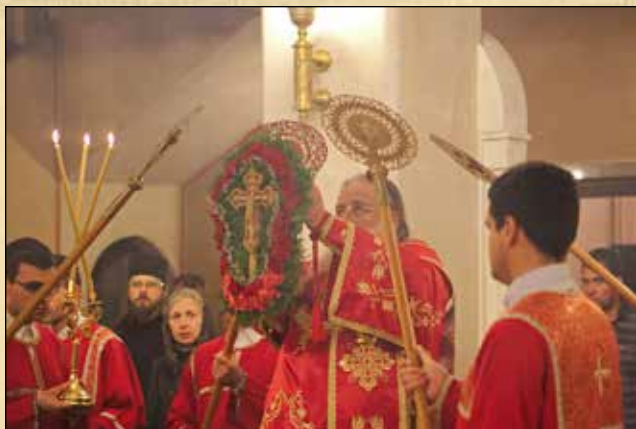
Чин на въздигане на св. Кръст в края на бдението за празника Въздвижение на св. Кръст, 26 септември (13 септември ст. ст.)