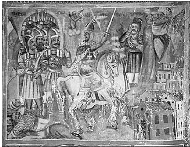
Бунтът на боулите. Стенопис от храма „Св. Димитър“, с. Тешово, XIX в.

„Когато станало известно, че се е покръстил, той (Борис – б. м. Д. Ч.) се намерил пред въстанието на целия свой народ, като носел на гърдите си изображението на Божия кръст, той с помощта на малко хора ги победил, а останалите направил християни не вече тайно, но напълно явно и с тяхно желание.“ 3