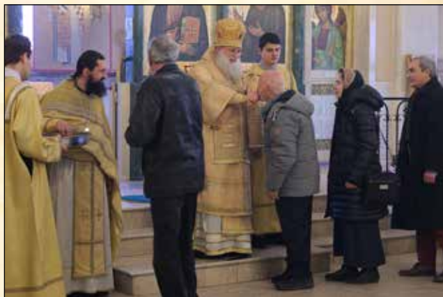
Благословение в края на св. Литургия в Неделя 28. след Петдесетница, на светите Праотци Христови, 27 декември (14 декември ст. ст.)