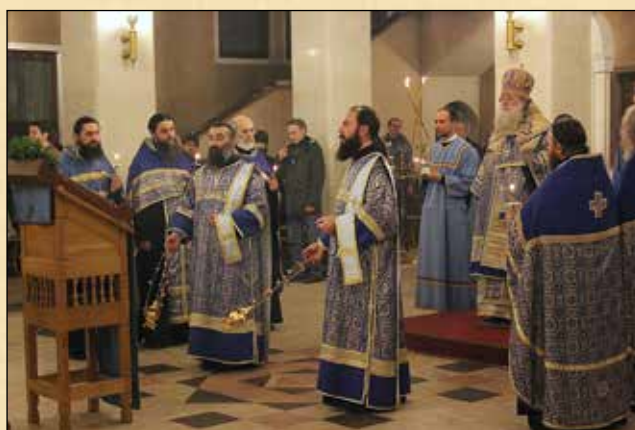
Петък на петата седмица от Великия пост – утрения с Богородичен акадист, 27 март (14 март ст. ст.)