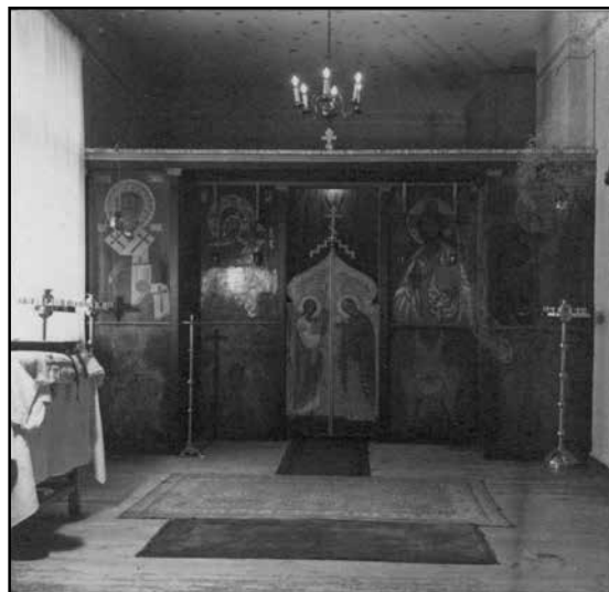
Манастирът на ул. „6-ти септември“ № 51 – домашният параклис „Покров Богородичен“

Противопоставянето на светител Серафим на българските църковни модернисти обаче предизвиква крайно неудоволствие у съветските власти 8 . Те смятат, че действията си той отблъсква „прогресивните“ свещеници от Московската патриаршия. Основане на нов манастир, монархически и антиболшевишки възгледи, създаване на пречки за „прогресивни“ реформи в Българската Църква – това било вече сериозен актив срещу светителя. През месец януари 1950 г. в Съвета по въпросите на РПЦ обсъждат неговото уволнение 9 .