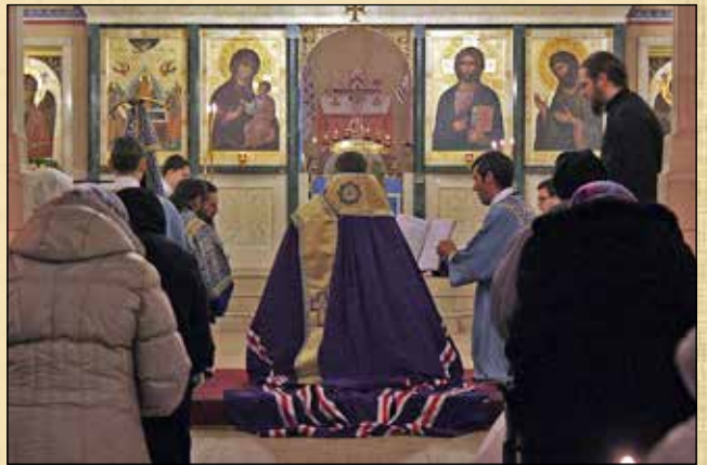
Молебен към св. Фотий, патриарх Константинополски, 19 февруари (6 февруари ст. ст.)