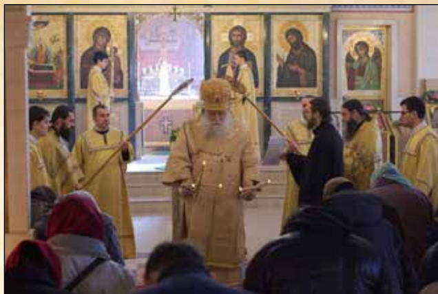
На Малкия вход на св. Литургия в Неделя 28. след Петдесетница, 13 декември (30 ноември ст. ст.)