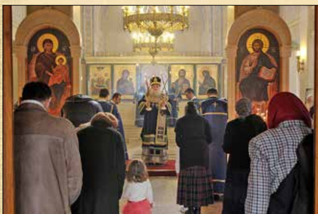
Неделя четвърта на Великия пост. Свети четиридесет мъченици в Севастия, 22 март (9 март ст. ст.)