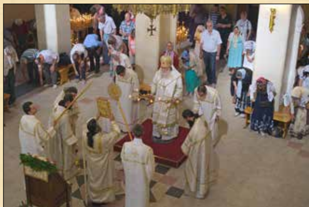
Преображение Господне, 19 август (6 август ст. ст.). Величанието по време на бдението и Малкият вход по време на св. Литургия, катедрален храм „Успение Богородично“, София