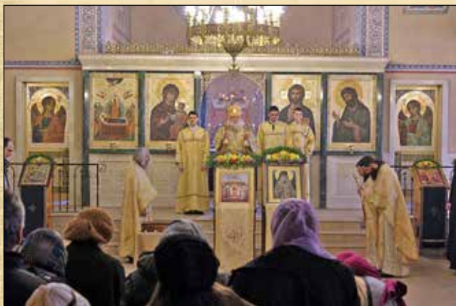
В края на светата Литургия в Неделя на Православието, 1 март (16 февруари ст. ст.)