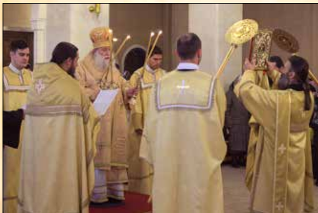
На Малкия вход на св. Литургия в Неделя 29. след Петдесетница, 20 декември (7 декември ст. ст.)