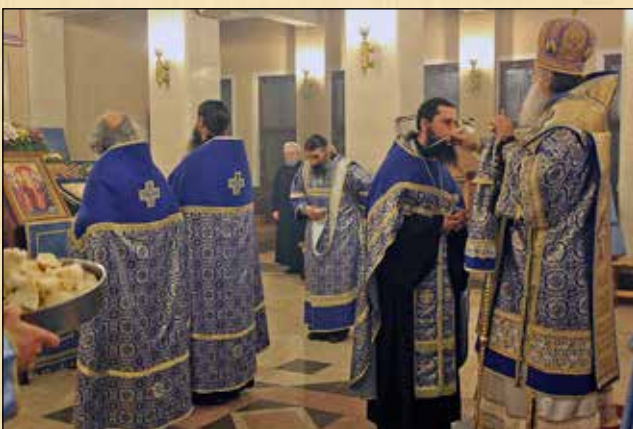
Бдение за празника Сретение Господне, Неделя на Страшния съд, 15 февруари (2 февруари ст. ст.)