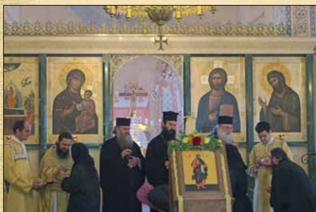
Посещение на поклонническа група от САЩ и Канада в България, начело с Американския митрополит Димитрий и гости от Румънската Православна Старостилна Църква, начело с Галацкия епископ Дионисий. 1-2 юли (18-19 юни ст. ст.)