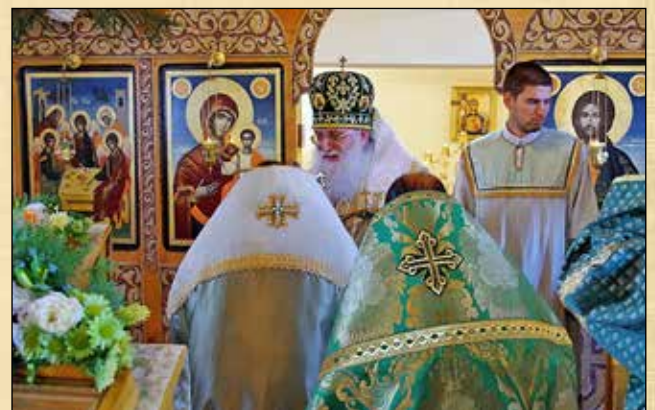
Освещаване на орехови клонки по време на деветия час преди вечернята на празника Петдесетница, 31 май (18 май ст. ст.)