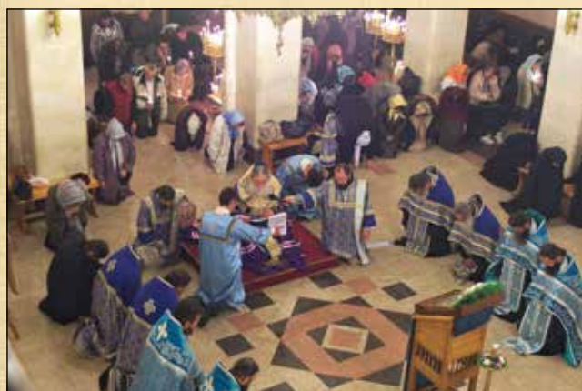
Паметна вечер, посветена на 20-годишнината от пребиваването на Иверската Монреалска мироточива икона на Пресвета Богородица в България в дните между 10–17 октомври 1995 г., 21 октомври (8 октомври ст. ст.) 2015 г.