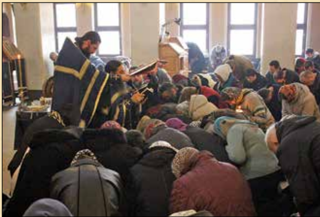
Велики четвъртък. Маслосвет, 9 април (27 март ст. ст.)