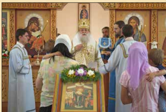
Причастяване по време на св. Литургия за престоления празник на храма „Пресвета Богородица – Радост на всички скърбящи“ във Велинград, 5 август (23 юли ст. ст.)