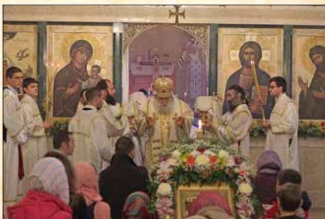
Вляво: Подпелей на бдението. Вдясно: Причастяване на светата Литургия за празника, 6 и 7 януари 2016 г. (24 и 25 декември ст. ст. 2015 г.)