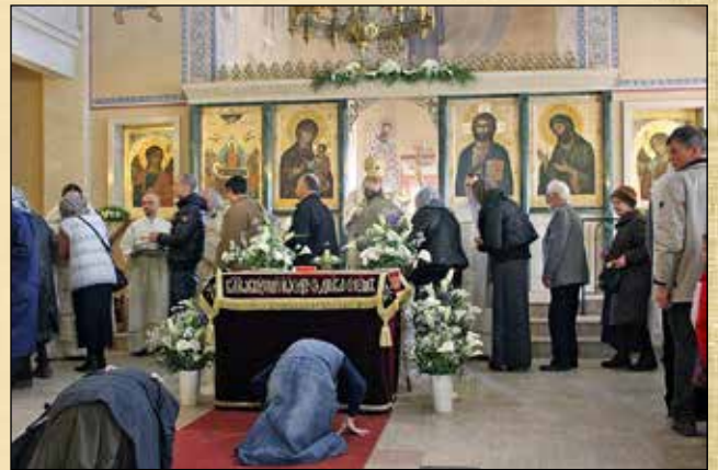
Велика събота, 11 април (29 март ст. ст.) – благословение в края на св. Литургия