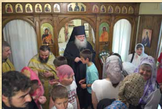
Престолен празник на храм „Свети пророк Илия“ в Плевен, 2 август (20 юли ст. ст.)