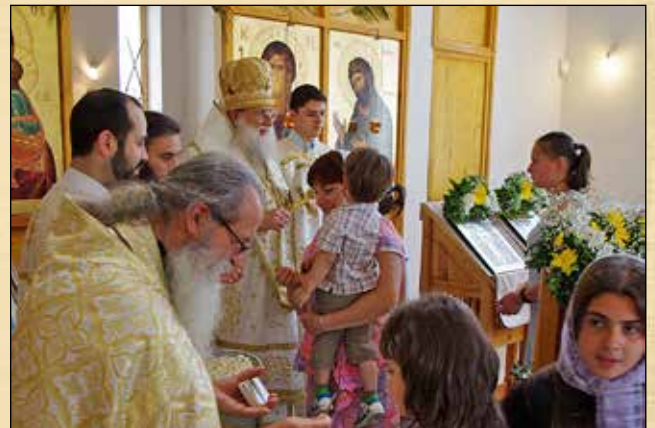
Малкият вход по време на св. Литургия за празника Възнесение Господне, катедрален храм „Успение Богородично“, 21 май (8 май ст. ст.)