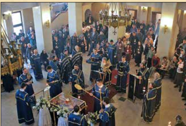
Велики петък вечерта, 10 април (28 март ст. ст.) – утреня на Велика събота с Опело Христово