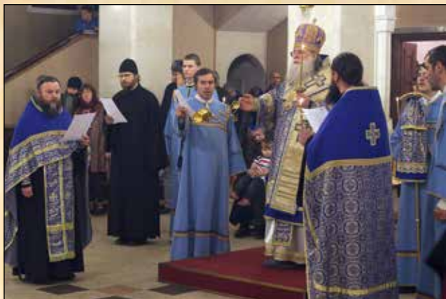
Величание на бдението за празника Въведение Богородично, 3 декември (20 ноември ст. ст.)