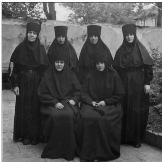
Първите шест сестри на манастира, постригани от светител Серафим

в това, чиновниците казват: „Защо са му на архиепископ Серафим апартаментите на Величкови?! Държавата може да отпусне цяла къща за неговия манастир!“ Светител Серафим приема тези думи като Божие указание и на празника Покров Богородичен подава ново писмо в Министерството с молба държавата да предостави самостоятелна къща за устройване на манастира. Тогавашните служители в Министерството се видели в чудо. Сами предложили и ето че сега ще трябва наистина да дадат нещо! И точно на Никулден дали апартамент в центъра на София 6 . Но по това време светител Серафим е вече съвсем болен.