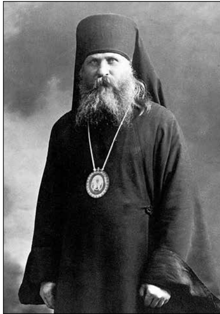
Архиепископ Вениамин (Федченков)

ква, чиито мнения не съвпадат с нейното учение. Например в творенията на св[ещеномъченик] Иринея, епископ Лионски има учение за хилядолетното земно царство на Иисус Христос (Сочинения Св[ященномученика] Иринея, епископа Лионского. СПб. 1900 г. кн. 5-я против ересей, стр. 519-526). В творенията на св[етител] Григорий Нисийски, в частност в неговия разговор със сестра му Макрина, въз основа на гумите на