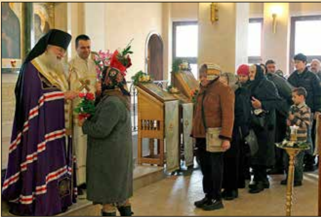
Поздравления след молебна към светите 70 апостоли по случай 22-годишнината от архиерейската хиротония на Негово Преосвещенство Триадицкия епископ Фотий, 17 януари (4 януари ст. ст.) 2015 г.