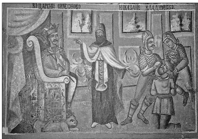
Възцаряване на Симеон и ослепяване на Владимир. Стенопис от храм „Св. Димитър“, с. Тешово, XIX в.