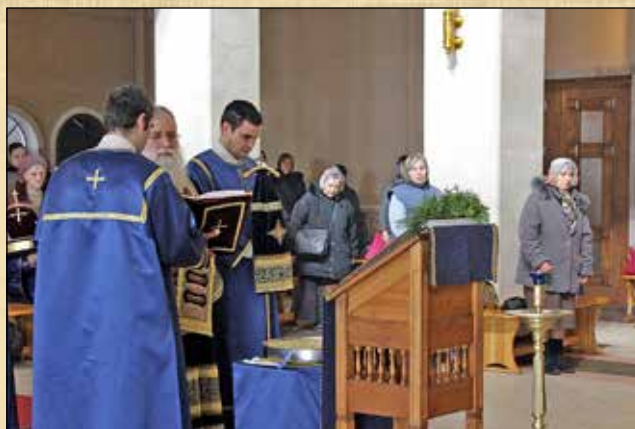
Освецаване на колигото в чест на св. великомъченик Теодор Тирон в петък на първата седмица от Великия пост, 27 февруари (14 февруари ст. ст.)