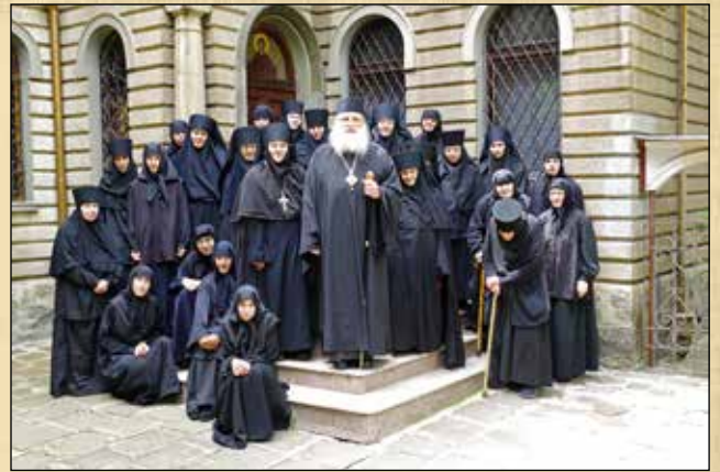
65 години от официалното откриване на Княжевската девическа обител „Покров на Пресвета Богородица“, 16 май (3 май ст. ст.) 2015 г.