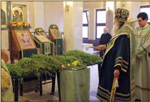
Освецаване на върбови клонки на бденната служба за празника Вход Господен в Йерусалим, 5 април (23 март ст. ст.)