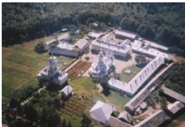
Женският манастир „Брадицел“, област Нямц. Съвременна снимка.