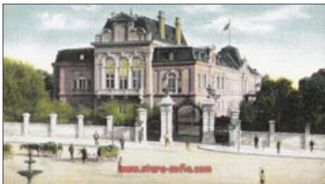
Царският дворец откъм площад „Александър“

Си и явно отказвал да изпълни прощата му.