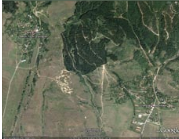
Сателитна карта на селата Туроковци и Забел