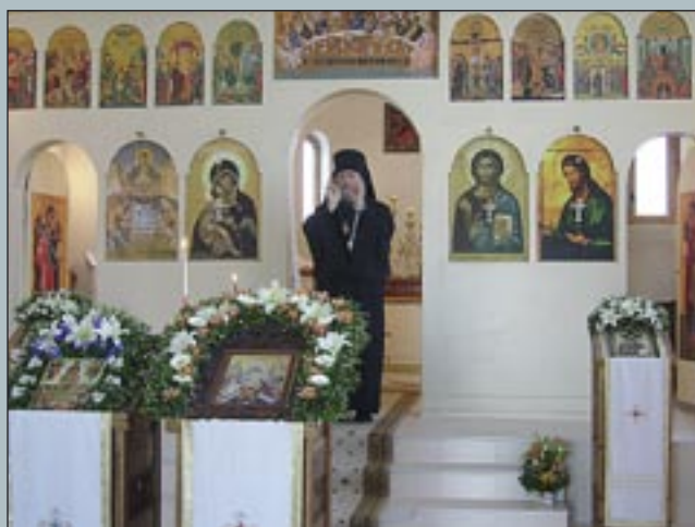
ПРЕСТОЯЩИЯТ ПРАЗНИК НА ХРАМА "ЖИВОПРЕЖЕН ИЗТОЧНИК", ГР. СЯНДЯНСКИ.

Светли петък, 13 април (31 март, ст. ст.) 2007 г.