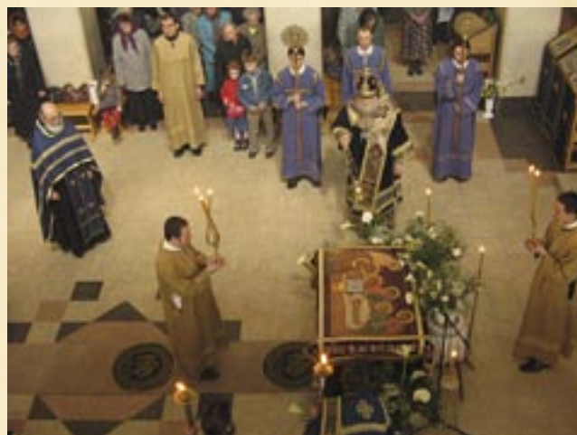
6 април (24 март, ст. ст.) 2007 г. Велики петък – изнасяне на св. Плащаница