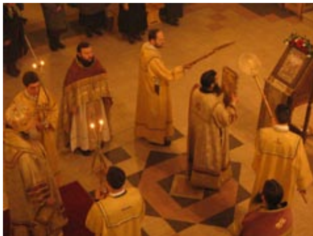
Малкият вход по време на св. Литургия в Неделята на блудния син, 4 февруари (22 януари, ст. ст.). Катедрален храм „Успение Богородично“

И тъй, докато у нас са живи самоузмамата, измамата, докато у нас растат, цъфтят и крепнат страстите, ние не можем да стъпим на пътя на истинското покая-