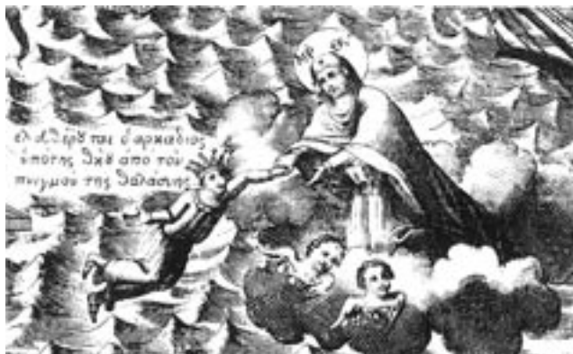
Пресвета Богородица спасява Аркадий. Детайл от медна литография на манастира, 1792 г.

названието Ватопег, което на гръцки език означава „храстът на момчето“. Преизпълнен с благодарност, императорът разширил манастира и го обогатил с много дарове. За спомен на това необикновено събитие по негова заповед бил построен храм, чийто олтар се намирал на самото място, където отк-