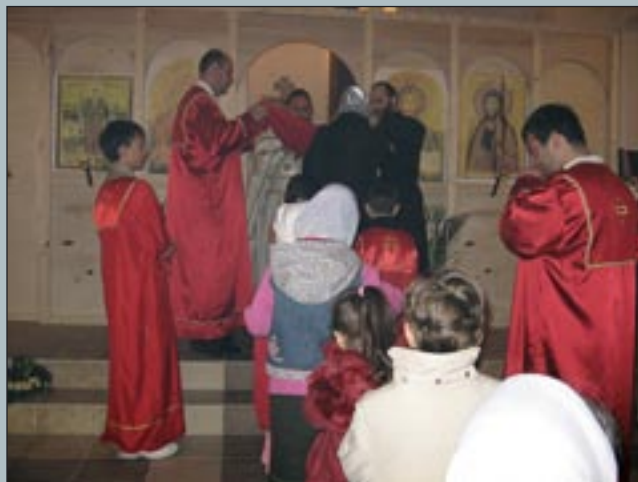
ПАСХА ХРИСТОВА В ХРАМА "СВ. БОСНИЯ ПЕТЕРБУРГСКА", ГР. ВАРНА