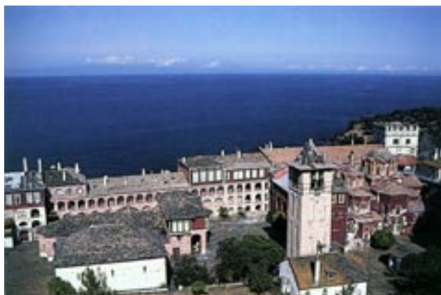
Ватопед. Северното крило на манастира.

Ужасен от видението, изуменият веднага събрал братята и им разказал за случилото се. Монасите, виждайки изменения вид на иконата, със създи на очи прославили милостивото застъпничество на върховната Покровителка на Атон. След това те побързали да се изкачат на високите стени на обителта и отблъснали враговете. Така с помощта на дивната небесна Застъпница манастирът бил спасен от разрушение, а монасите от сигурна смърт. От това