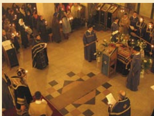
6 април (24 март, ст. ст.) 2007 г. Велики петък – Опело Христово