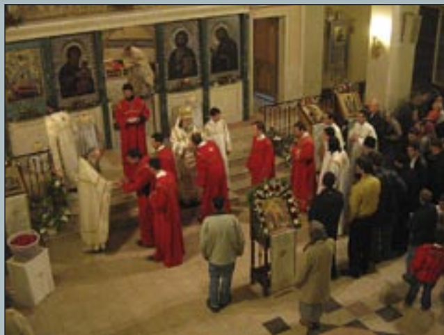
ПАСХА ХРИСТОВА В КАТЕДРАЛНИЯ ХРАМ "УСНЕНИЕ БОГОРОДИЧНО", ГР. СОФИЯ