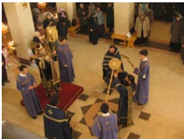
Момент от св. Литургия в Неделя четвърта на Великия пост, 18 март (5 март, ст. ст.). Катедрален храм „Успение Богородично“

Наистина подвижническият светоевангелски християнски живот, духовната бран, неминуемо са свързани с напрежение и с усилие. Но подвигът в християнството не е мъчително самоограничаване, не е тягостно самопринуждаване. Ако човек се стреми да води християнски живот, като непрекъснато си повтаря, че трябва да направи това или онова – трябва да се помоли, трябва да пости... да, тогава е наистина много тежко. Законническите и формални подбуди за подвижнически живот вещаят поражения в духовната бран, доколкото изобщо сме я подели. Стойностната, същинската подбуда за християнския подвиг е разкриването на сърцето за Божията любов. Ако някой се