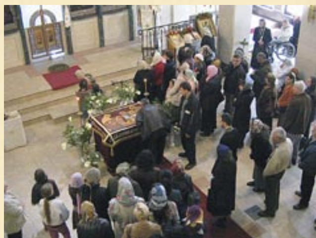
7 април (25 март, ст. ст.) 2007 г. Велика събота и Благовещение на Пресвета Богородица.