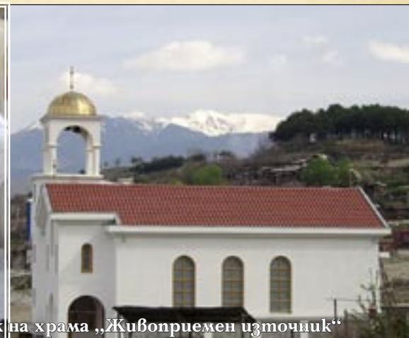
28 април (15 април, ст. ст.), Сандански. Престолният празник на храма „Живоприемен източник“