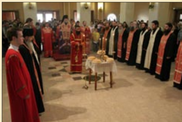
Бдението за баташките новомъченици. 16 май (3 май, ст.ст.)