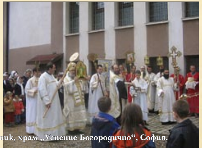
23 април (11 април, ст. ст.), Светли понеделник, храм „Успение Богородично“, София.