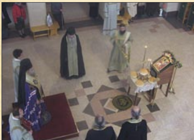
15 април (2 април, ст. ст.) 2006 г. Бдение за празника Вход Господен в Йерусалим в храма „Успение Богородично“, София.