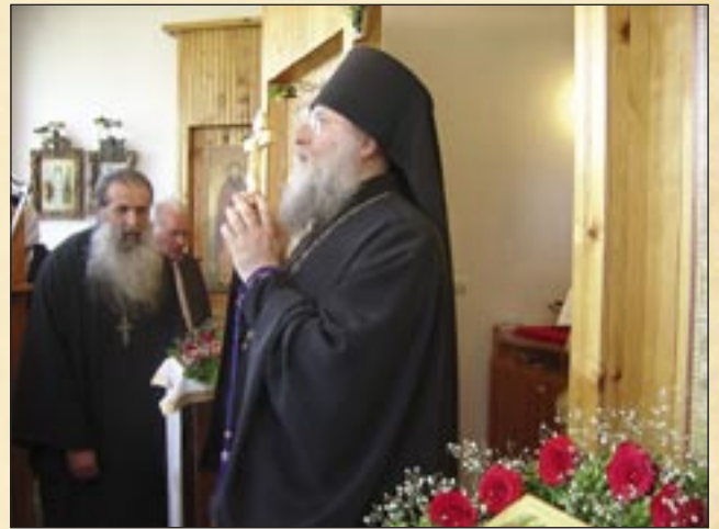
24 май (11 май, ст. ст.), Благоевград. Престолният празник на параклиса „Св. св. Кирил и Методий“.