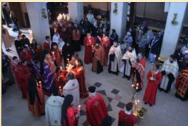
Последната панихида за баташките новомъченици. 16 май (3 май, ст.ст.)