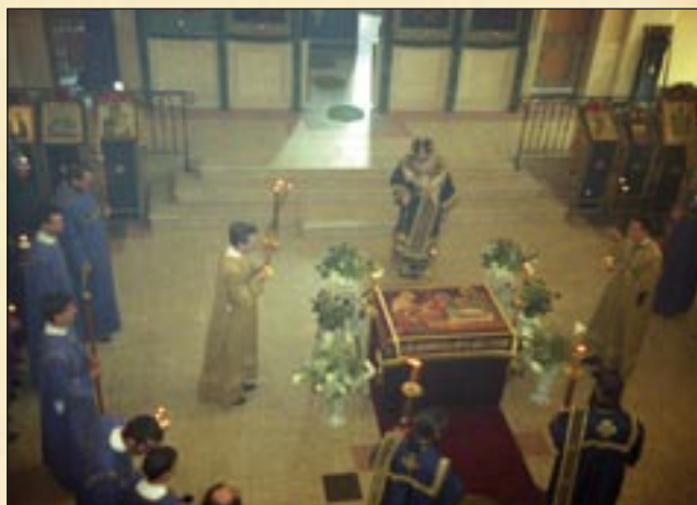
21 април (8 април, ст. ст.) 2006 г., Велики петък. Вечерня с изнасяне на св. Плащаница в храма „Успение Богородично“, София.