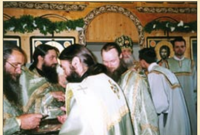
12 юни (30 май, ст. ст.), гр. Гоце Делчев. Моменти от престолния празник на храма „Света Троица“.