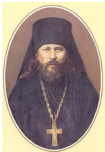
Преп. Никон Оптински

му. Не бива да се отнасяме към хората хладно и с това да ги отблъскваме от себе си.