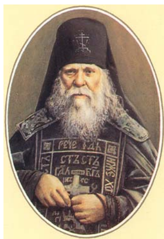
Преп. Анатолий Оптински (старши)

❖ Вижда се, че се стараеш и искаш да се спасиш, само че не умееш – не разбираш духовния живот. А цялата тайна е в това – да търпиш, каквото Бог ти изпрати. Така без да усетиш, ще влезеш в рая.