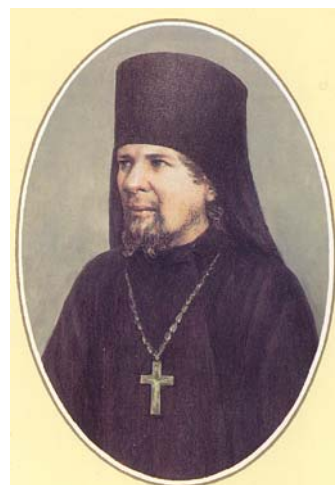
Преп. Нектарий Оптински

❖ Смисльът на християнския живот, според гумите на св. ап. Павел в Посланието му