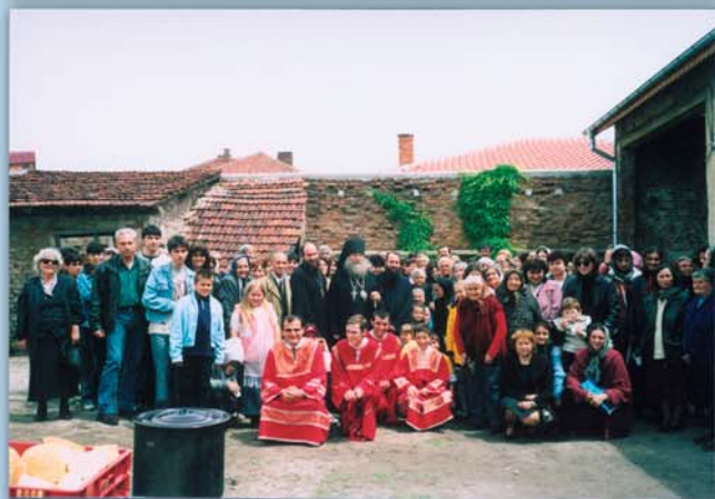
Моменти от престолния празник на храма „Св. вмчк Георги Победоносец“ край гр. Стамболийски. 6 май (23 април, ст. ст.) 2004 г.

приснопамятния о. Серафим (Роуз). Човек насочва погледа към себе си, човек започва застрашаващо да губи понятието за жертва в името на другия, да губи усетливост към потребността на другия, към страданието на другия, изобщо към другия. Човек страда – и то болезнено и дълбоко, – защото не получава това, което смята, че има право да получи. Но той не страда от това, че не дава, че сърцето му губи способност да почувствува, да разбере другия. Та ние не можем да видим ближния си, не можем да чуем ближния си! Как тогава ще видим и ще чуем своя Творец и Спасител?