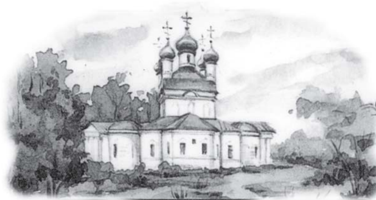
Съборният храм „Въведение Богородично“ в Оптинския манастир

❖ Тези, които търсят Христа, Го намират, според Неговите истинни слова: Търсете, и ще намерите; хлопайте и ще ви се отвори (Мат. 7:7, Лука 11:9). В дома на Отца Ми има много жилища (Иоан. 14:2). И забележете, че тук Господ говори не само за небесни жилища, но и за земни, не само за вътрешни, но и за външни. Всяка душа Той поставя в такива обстоятелства, обкръжава я с такава обстановка, която най-много ще допринесе за нейното преуспяване – това е външното жилище. А когато Той изпълва душата с покой, мир и радост –