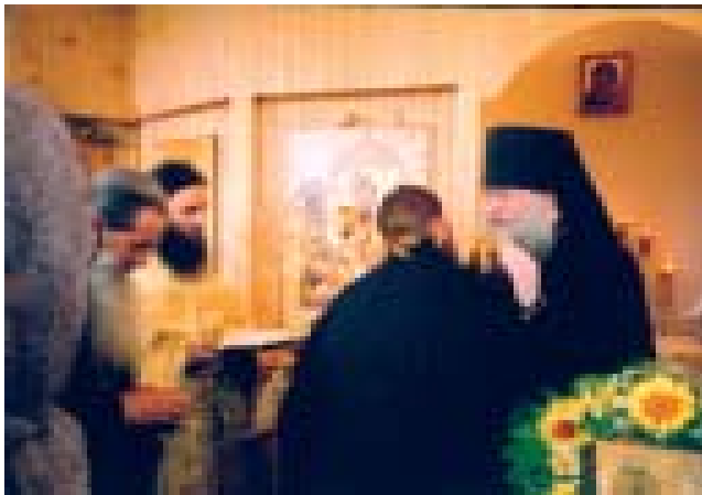
На снимките горе и вдясно: моменти от храмовия празник на параклиса „Св. св. Кирил и Методий“ в Благоевград. 24 май (11 май, ст. ст.) 2004 г.

Простете ни и ни помогнете, наши родни небожители! Молете Христа за нас, умъртвените българи, за духовните мъртъвци във все още живи тела. Молете Го да ни възкреси, та да оживеем в Него и за Него, да оживеем за небесната правда и небесния живот, сега и всякога и във вечни векове.“