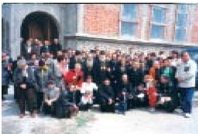
16 април (3 април, ст. ст.) 2004 г., храм “Живоприемен Източник“, гр. Сандански. Моменти от престолния празник. Горе: осветените кръстовете увенчаха храма.