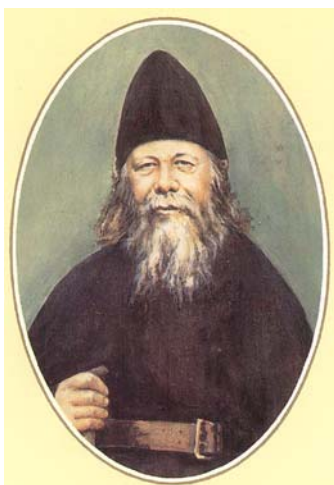
Преп. Анатолий Оптински (младши)

превръща в роб на житейските обстоятелства, не трябва да принася вътрешното (т.е. душата си – бел. прев.) в жертва на външното. Често служейки на тукашния си живот, човек губи мярка, труди се безразсъдно и изпада в твърде печално недоумение: сам не знае защо живее. Това недоумение е много опасно и често се случва с хората. Те стават подобни на кон, който пренуска, пренуска и изведнъж се блъсне във внезапно изсочило насреща препятствие.