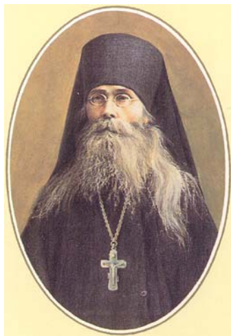
Преп. Варсануфий Оптински

❖ За да станем подобни на Бога, трябва да изпълняваме Неговите свети заповеди, а ако погледнем внимателно, ще се окаже, че досега нито една от тях не сме изпълнили истински. Прехвърлим ли ги всичките поглед, ще видим, че до някоя от тях едва-едва сме се докоснали, друга може би малко сме се опитали да изпълним, а например към заповедта за любов към враговете даже не сме пристъпили. Какво да правим тогава ние, грешните? Как да се спасим? – Единствено чрез смирението. Моли се така: „Господи, аз съм грешен във всичко, нищо добро няма в