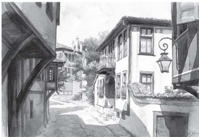
Старият Пловдив, худ. Янко Янев

остана с четири невръстни гечица, за да оплаква окаяния си мъж, и не знаеше какво ще си изплати и тя самата.