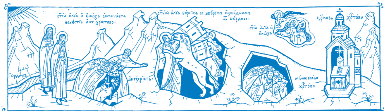
АПОСТАСИЯ - ОТСТЪПЛЕНИЕ