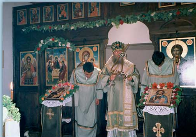
Моменти от престолния празник на храма „Св. Троица“ край гр. Гоце Делчев. 31 май (18 май, ст. ст.) 2004 г.