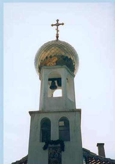
Камбанарията на храма „Св. Троица“ край гр. Гоце Делчев.