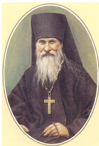
Преп. Йосиф Оптински

❖ Съвестта на човека прилича на будилник. Ако позвъни и ти, като знаеш, че трябва да отидеш на послушание, веднага станеш, то и сетне винаги ще го чуваш. Ако не ставаш няколко дни подред и си казваш: „Ще полежа още малко“, накрая вече няма да се събуждаш, когато будилникът звъни.